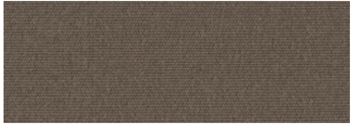
8203 ARDOISE OK